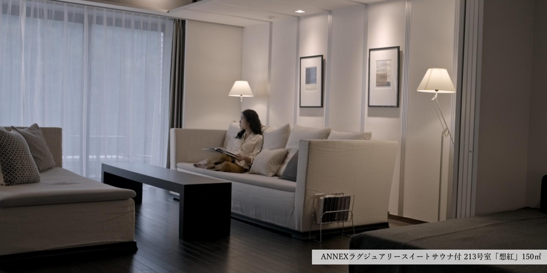
ANNEXラグジュアリースイートサウナ付 213号室「想紅」 150㎡