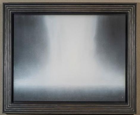
《ウォーターフォール》 千住 博