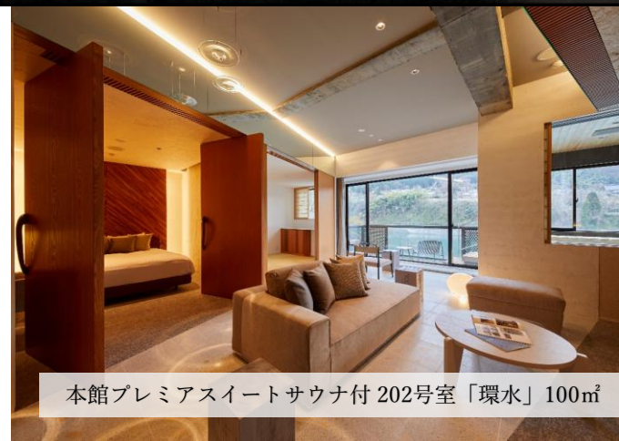
本館プレミアスイートサウナ付 202号室「環水」 100㎡