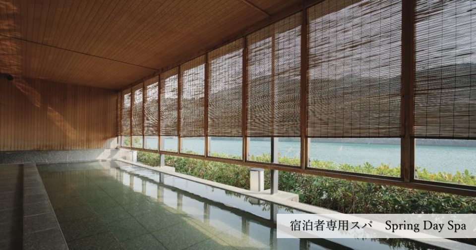
宿泊者専用スパ Spring Day Spa