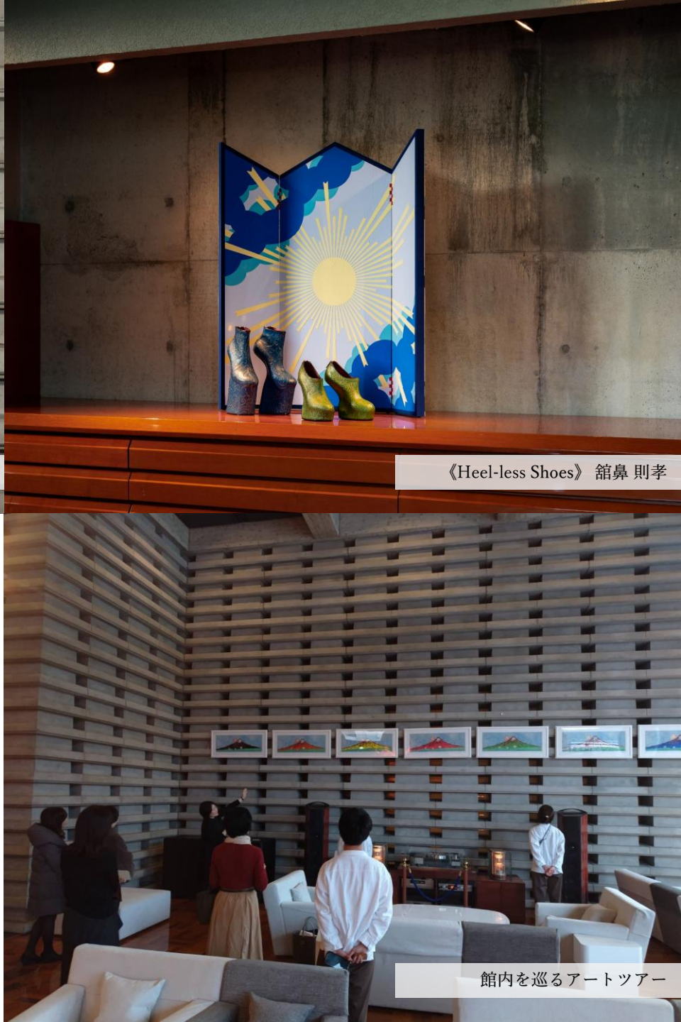
館内を巡るアートツアー

毎週金曜・土曜は16:00よりアートツアーを開催しています。制作背景や裏話を交えながら、アートをより身近に感じていただける体験をお楽しみいただけます。