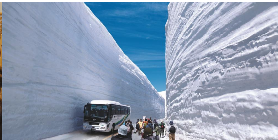
立山黒部アルペンルート「雪の大谷」