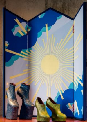
《Heel-less Shoes》 館鼻 則孝