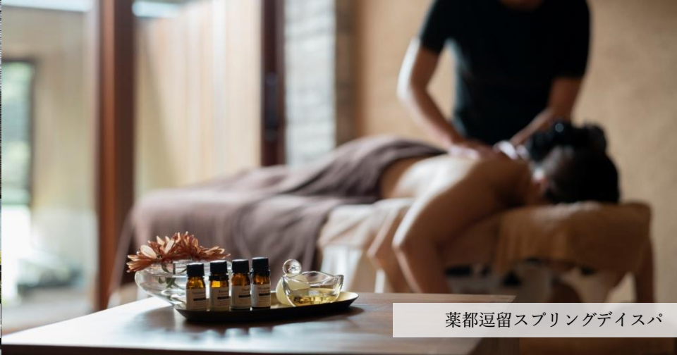
薬都逗留スプリングデイスパ