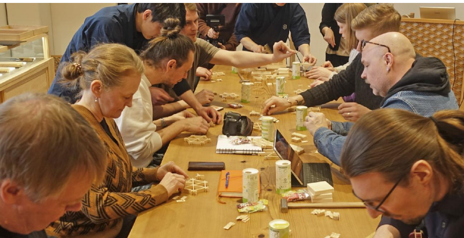
組子細工タニハタ・組子制作体験